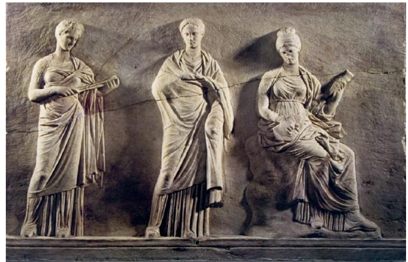
Três Musas, século IV a.C., Museu Arqueológico Nacional de Atenas.

✓ Religião, tradições e mitos passaram a não convencer.