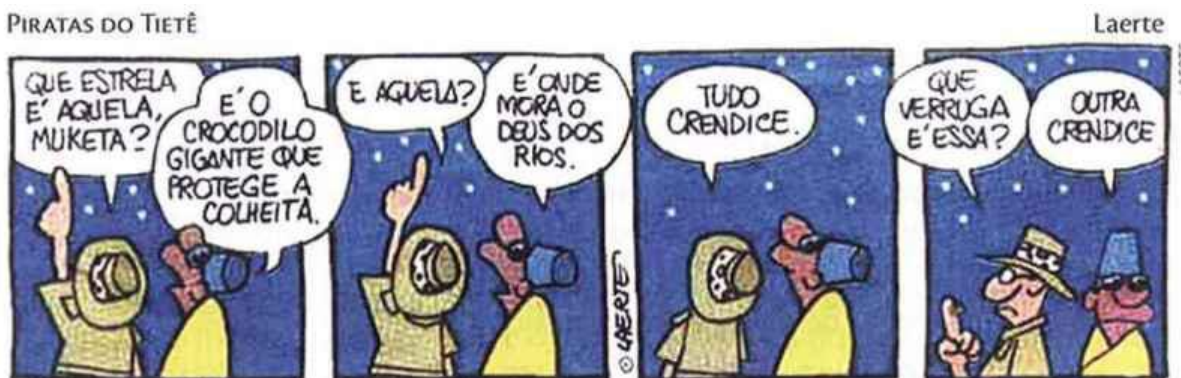
▲ LAERTE. Piratas do Tietê. Folha de S.Paulo. São Paulo, 29 mar. 2003.

Em relação aos pronomes da tirinha, é correto afirmar que: