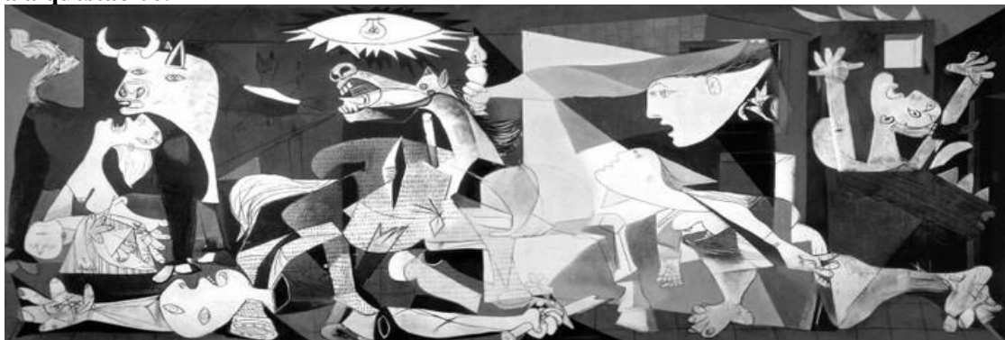
PICASSO, P. Guernica . Óleo sobre tela. 349 × 777 cm. Museu Reina Sofia, Espanha, 1937.

O pintor espanhol Pablo Picasso (1881-1973), um dos mais valorizados no mundo artístico, tanto em termos financeiros quanto históricos, criou a obra Guernica em protesto ao ataque aéreo à pequena cidade basca de mesmo nome.