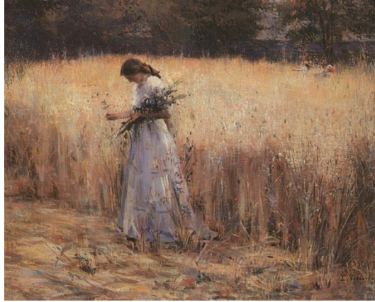
Eliseu Visconti - Moça no Trigo – 1916

QUESTÃO 03. O simbolismo foi contemporâneo a um movimento de grande importância das artes plásticas, o Impressionismo, analise a pintura abaixo e aponte as inovações trazidas por esse movimento.