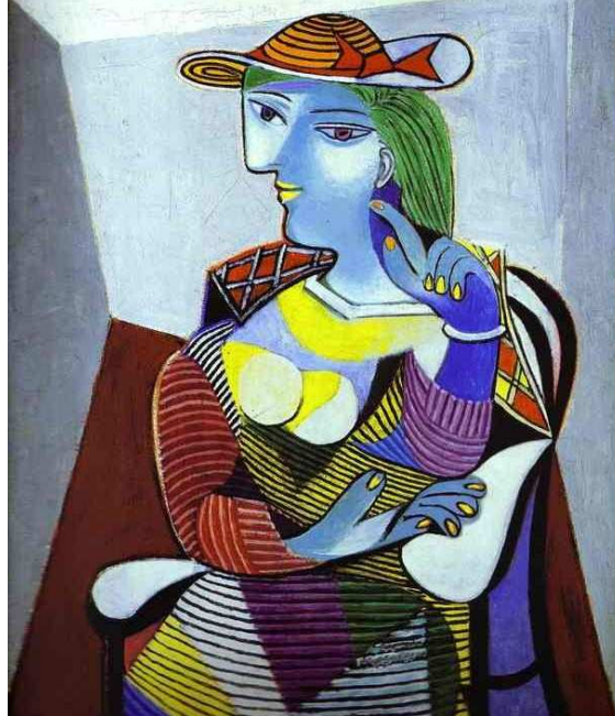
PICASSO, P. Retrato de Marie Thérèse Walter- Óleo sobre tela. 349 × 777 cm. Museu Reina Sofia, Espanha, 1937.

Questão 01. Identifique a vanguarda artística representada na obra em análise.