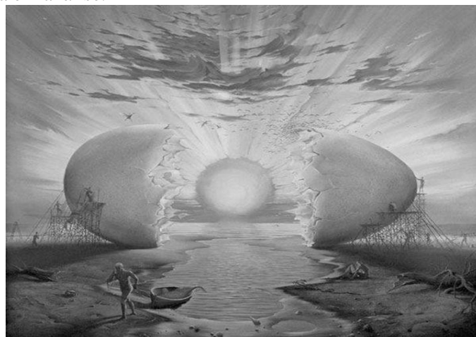
O ovo Cósmico – Salvador Dalí

Questão 02. A arte surrealista de Salvador Dalí é um importante símbolo das vanguardas europeias, comente os traços do surrealismo na obra em análise.