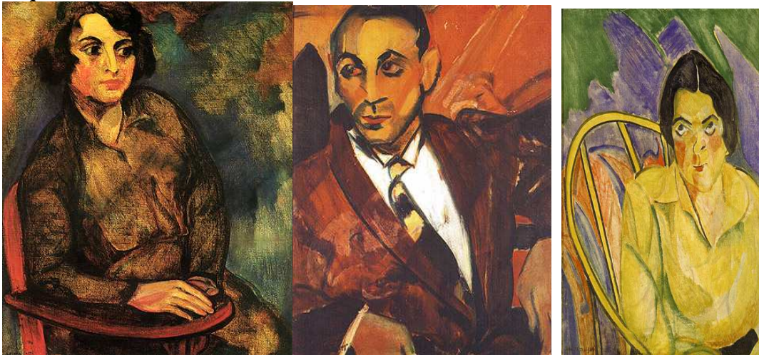
A estudante russa (1915), O homem amarelo (1915-16), A Boba (1915-1916) Obras de Anita Malfatti.

Questão 06. Comente de que maneira as obras da artista Anita Malfatti, expostas em 1917, criticadas por Monteiro Lobato, influenciaram a Semana de Arte Moderna?