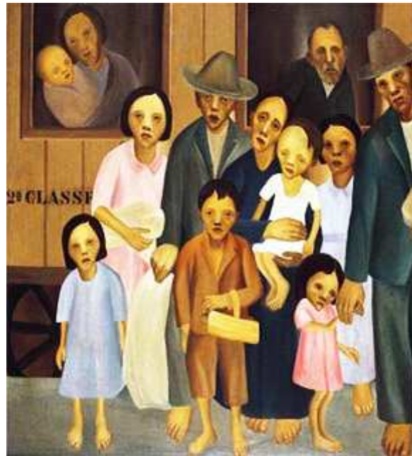
Segunda Classe- Tarsila do Amaral 1933- Óleo sobre Tela-110 x 151 cm. Coleção particular, São Paulo, Brasil

Questão 12. Aponte as características da pintura de Tarsila do Amaral e sua ligação com a temática da segunda geração do modernismo no Brasil.