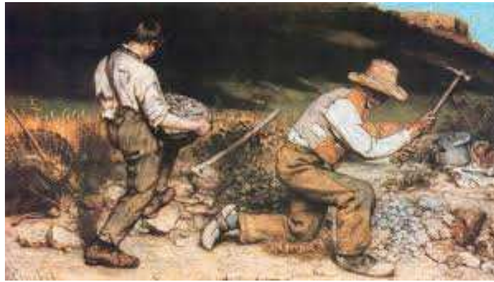
Os quebradores de pedras- Gustave Courbet, 1849

QUESTÃO 11. Aponte o contexto histórico que foi berço, estímulo da estética realista.