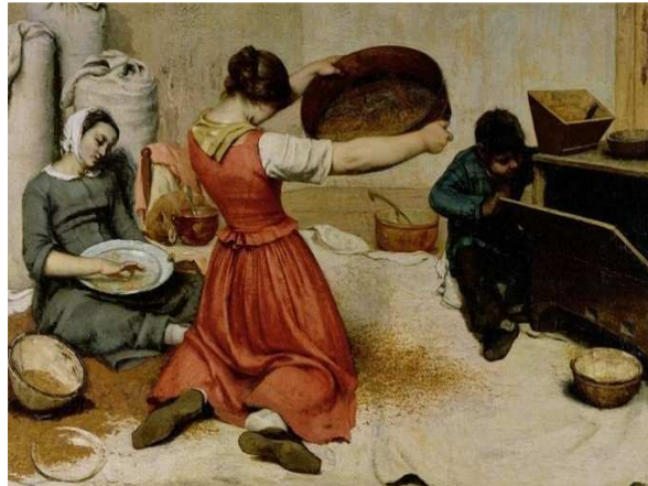
Moças peneirando trigo (1853-54), de Gustave Coubert, mostra o trabalho braçal feminino

QUESTÃO 15. Aponte o contexto histórico que foi berço, estímulo da estética realista.