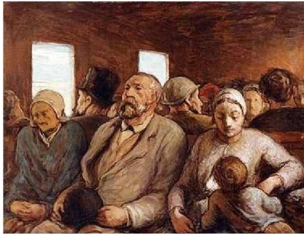
O vagão de Terceira Classe- J. B. Daumier(1808-1879)

Na tela acima vemos a pintura intitulada " O vagão de terceira Classe, Daumier"- 1862, que faz parte de um ciclo importante da reflexiva obra do artista. O rei Louis Philippe prendeu Daumier, por conta do artista ter produzido uma caricatura do rei engolindo sacos de ouro extorquidos do povo, mas mesmo assim continuou produzindo obras provocadoras, entre elas podemos destacar "O vagão da terceira classe" onde o artista retrata um grupo de trabalhadores que viviam em condições sub humanas, ao olharmos para a cena temos a sensação de que as pessoas estão tristes em um espaço apertado como meros animais.