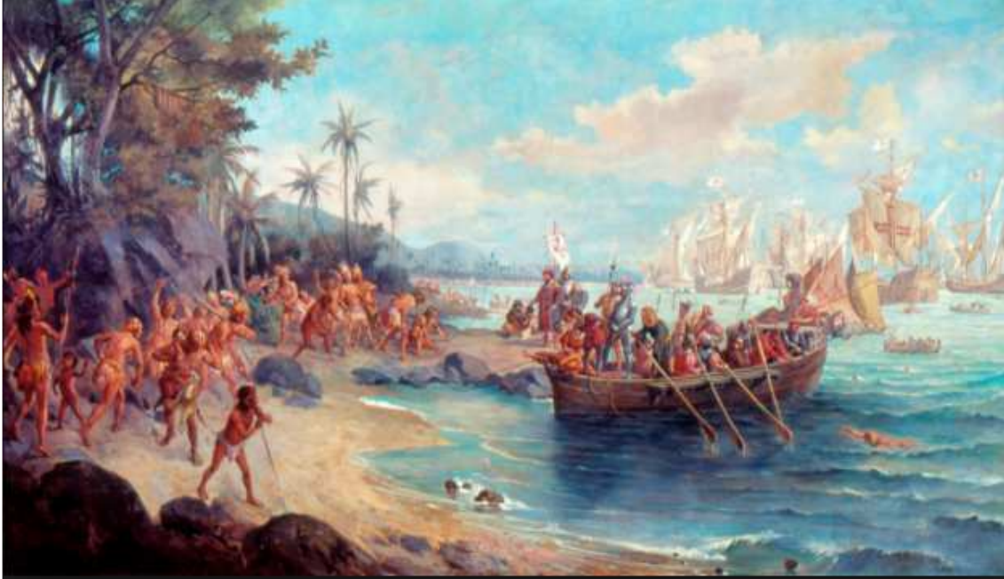
Desembarque de Cabral, de Oscar Pereira da Silva-

A obra “Desembarque de Pedro Álvares Cabral em Porto Seguro em 1500” é uma pintura a óleo sobre tela do artista brasileiro Oscar Pereira da Silva, com 190 centímetros de altura e 330 de largura. A tela foi finalizada no ano de 1900 e representa o primeiro desembarque dos navios de Pedro Álvares Cabral em terras brasileiras.