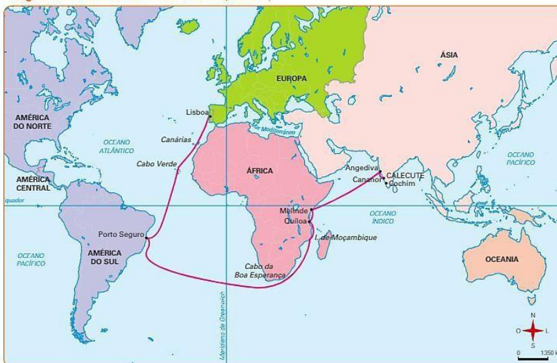
Viagem de Cabral ao Brasil e Calecute, 1500