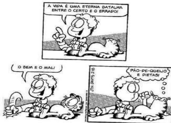
Disponível em: < https://tirinhasdogarfield.blogspot.com.br/ >. Acesso em: 23 out. 2017.

Questão 10. Localize os substantivos que representam, para o Garfield, os conceitos de “bem” e “mal”: