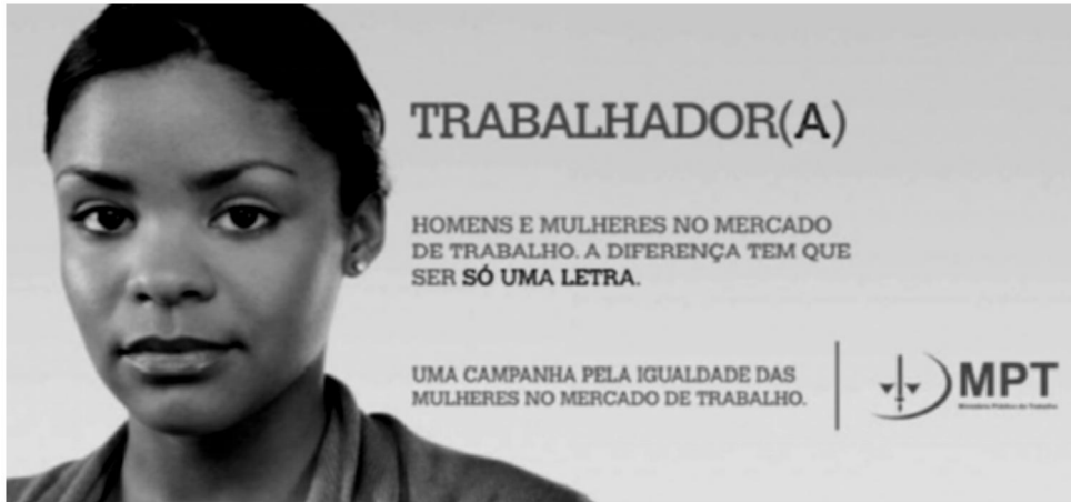
Ministério Público do Trabalho no Rio Grande do Sul.

Questão 18. No contexto do anúncio a relação de sentido existente entre a imagem e o conteúdo verbal, transmitem qual reflexão?