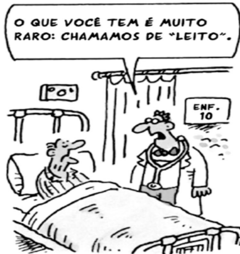
O QUE você tem é muito raro... Disponível em: < https://www.google.com.br/ >

Questão 09. O traço de humor presente no cartum decorre de qual reflexão?