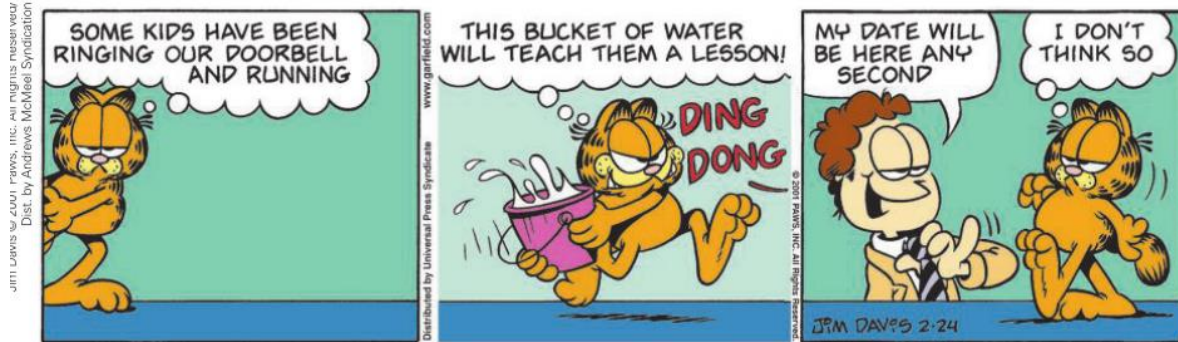
Garfield eats crow. His 39th Book by Jim Davis. p. 51.

Leia a tirinha e responda as questões de 01 a 05